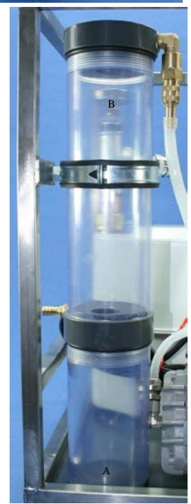
Trockenturm: A: Kondensatabscheider B: Silikagelfüllung