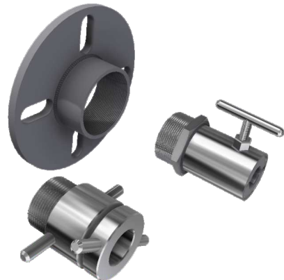
Schnell-Spann und gasdichte Halterung für Absaugrohr