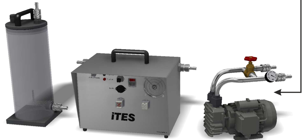
Absaugung: Trockenturm, ITES und Pumpe suction line: drying tower, ITES and pump

Staubmessung nach VDI 2066 / EN 13284-1 IN-Stack beheizte Lanze Dust measurement according to VDI 2066 / EN 13284-1 IN-Stack, heated probe